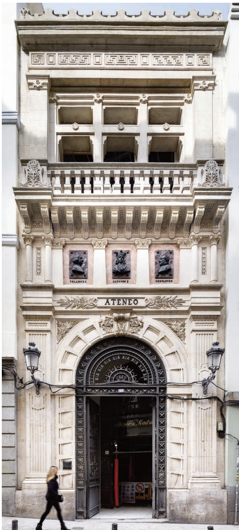
► Fachada principal de la calle Prado, 21.

racionismo, y lugar de acogida de nuevas corrientes científicas, tales como el evolucionismo, la radiactividad o la teoría de la relatividad (Marie Curie y Einstein expusieron sus teorías en el Ateneo). En sus salas, en fin, han debatido varias generaciones de políticos, científicos e intelectuales españoles: Echegaray y el resto de nuestros premios Nobel, Larra, Cánovas del Castillo, Clarín, Galdós, Pardo Bazán, Unamuno, Valle Inclán, Alcalá Zamora, Azaña, Gregorio Marañón, Ortega, Clara Campoamor, Pedro Salinas, Julio Caro Baroja, María Zambrano y tantos otros. Aunque las dos dictaduras del siglo XX –las de los generales Primo de Rivera y Franco– intervinieron la institución afectando gravemente a su actividad, el Ateneo siempre ha vuelto a sus principios fundacionales y sigue siendo hoy en día un referente imprescindible de la vida cultural madrileña.