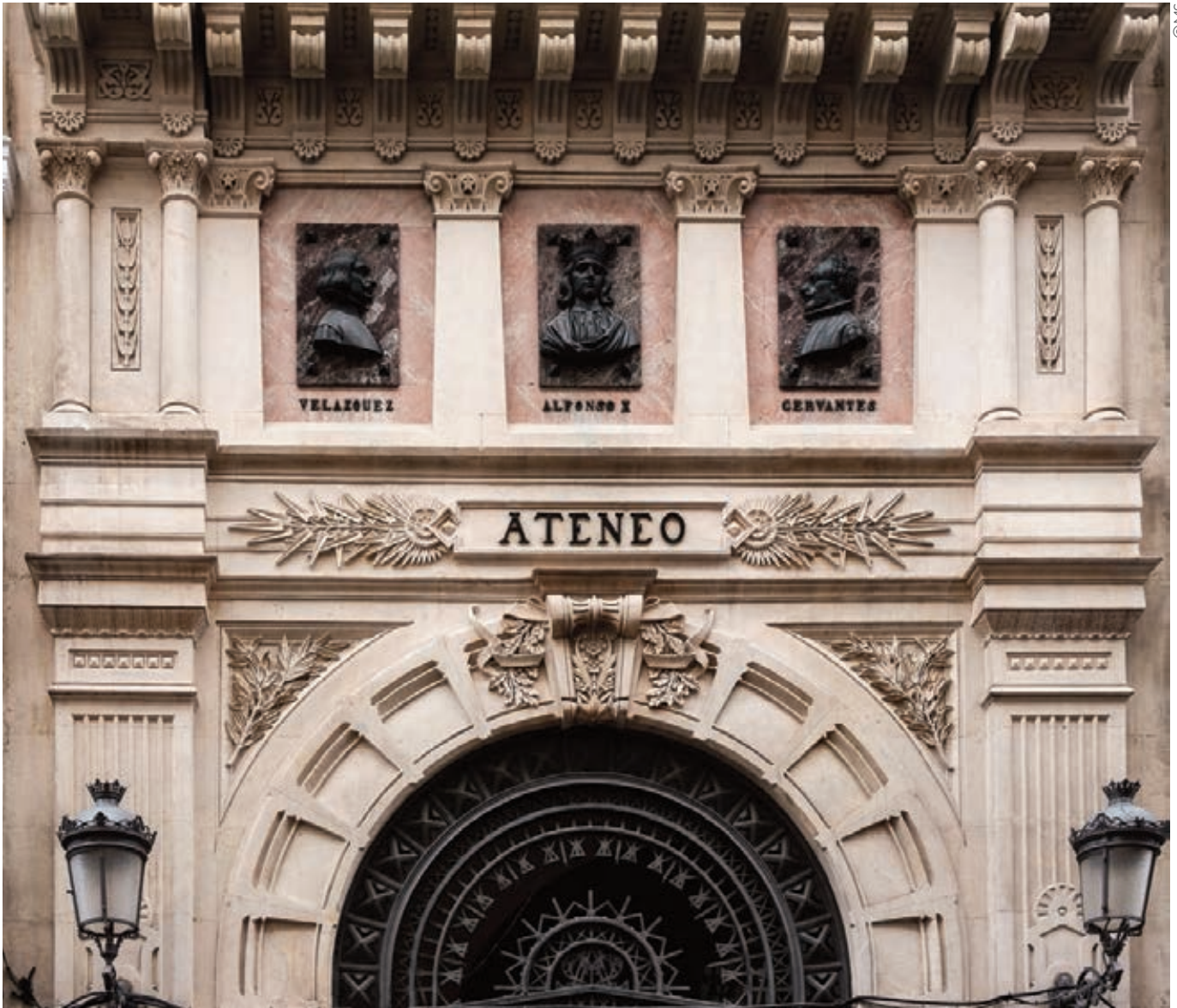
► Friso del portal de entrada.

estatutos que ningún otro nombre como el de Ateneo “expresaría con más propiedad el lugar donde hombres ansiosos de saber y amantes de su libertad política y social se reúnen para adelantar sus conocimientos, difundirlos y cooperar de ese modo a la superioridad de la nación”.