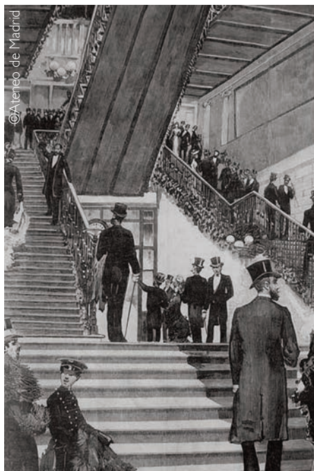
► Siglo XIX. Grabado de la inauguración del Ateneo en 1884.