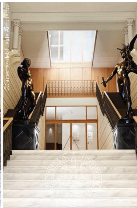
► Siglo XXI. Infografía del proyecto de rehabilitación.

La rehabilitación se completa con reformas en algunos de los espacios más emblemáticos de la institución, como la galería de Retratos, la Cacharrería, el despacho de Azaña o la “Pecera” de la Biblioteca, lugares donde las obras del pasado han llegado a desvirtuar las pinturas y volúmenes de los muros y techos debido a sucesivos morteros, repintados o instalaciones en puntos inadecuados.