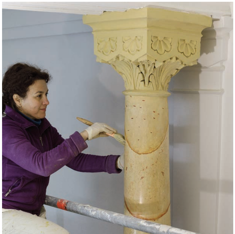
► El hall de entrada. Estado anterior y trabajos de reforma