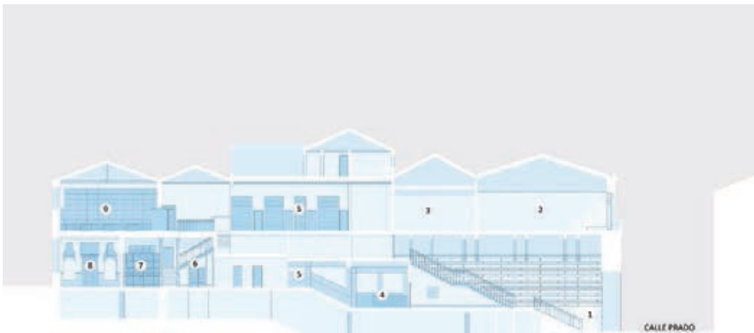
► Sección. Estado actual (arriba) y el que tendrá tras la reforma.

Además, sobre todo en momentos en que una universidad anquilosada no era capaz de responder a las inquietudes y demandas de transmisión del saber que pedía la sociedad, como ocurriera en el último tercio del siglo XIX, fue también crisol – junto a la Institución Libre de Enseñanza, otro pilar básico de la cultura de la época– en que se cultivaron y desarrollaron movimientos renovadores del pensamiento, como el krausismo o el regene-