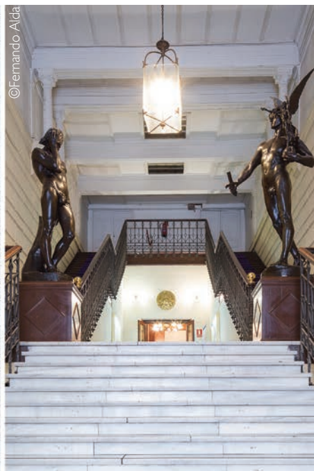
► Siglo XX. Fotografía del estado actual con los impactos negativos de las sucesivas reformas.